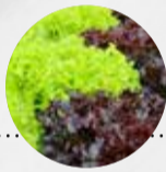
LOLLO ROSSO/ LOLLO BIONDA (Italien)