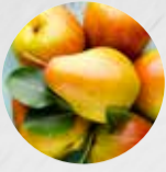
BIRNEN Williams, Gute Luise, Conference, Clapps Liebling (Deutschland)

Leider können wir Ihnen diese Produkte derzeit nicht liefern. Aber greifen Sie doch auf eine unserer geschmackvollen Alternativen zurück.