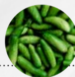
SCHMORGURKEN, LANDGURKEN, EINLEGEGERURKEN