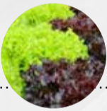
LOLLO ROSSO/ LOLLO BIONDA (Deutschland)